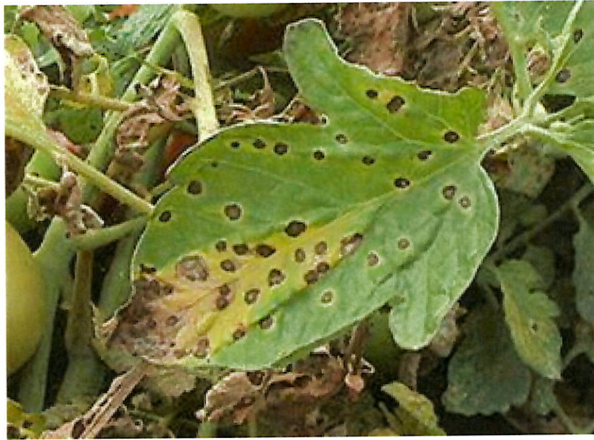
Atac pe frunze