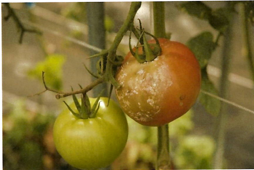
Atac pe fructe